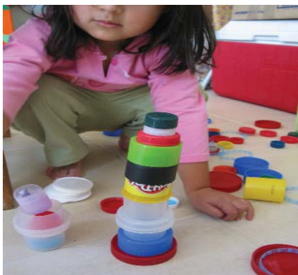
Todas las tapas o botecitos de plástico pueden servirte como bloques de construcción, solo recuerda tener mucho cuidado con las piezas pequeñas.