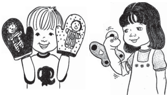
Sugerencias de títeres para las clases.