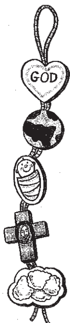
Con este móvil los peques pueden trabajar sobre el amor de Jesús. Basado en San Juan 3:16