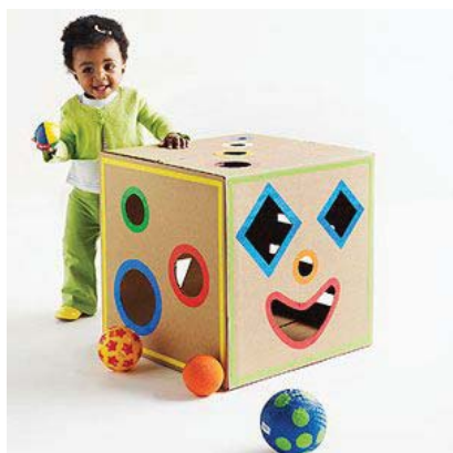
Cubo gigante de figuras con caja de cartón.